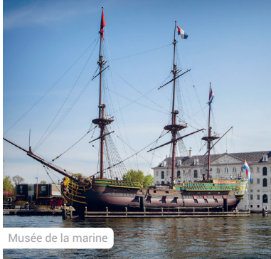
Musée de la marine