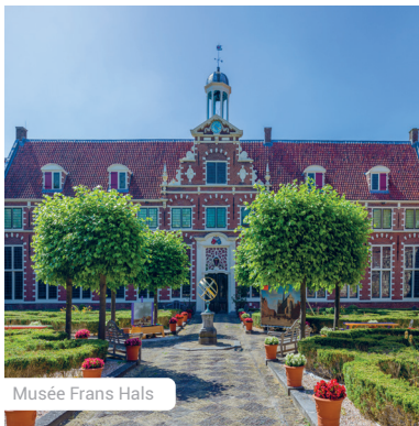
Musée Frans Hals