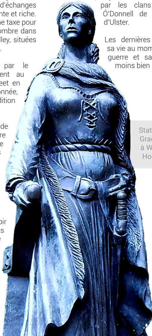
Statue de Grace Ó'Malley à Westport House

Les dernières années de sa vie au moment de cette guerre et sa mort sont moins bien connues.