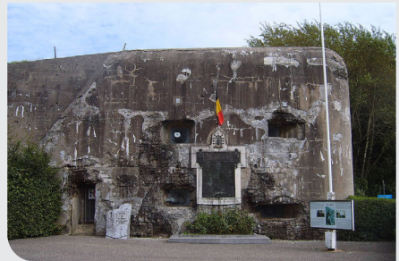
Abbaye de Val Dieu & Fort de Battice