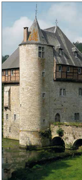
Château de Crupet

Le village connut une industrie florissante au XIX e siècle ainsi qu'en témoignent ses cinq moulins, une papeterie, une saline, une huilerie, une forge et une brasserie.