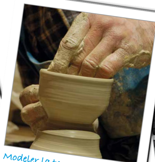
Modeler la terre...