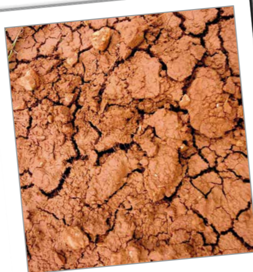
Terre - matière