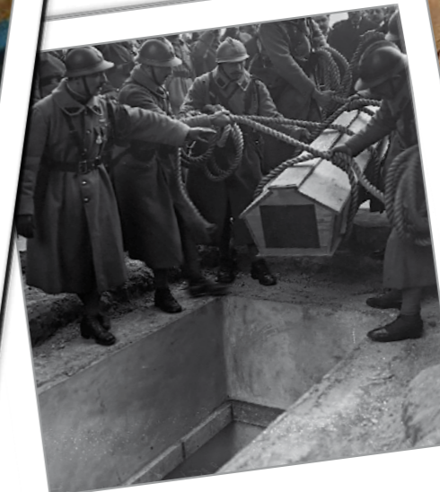
Retour à la terre...