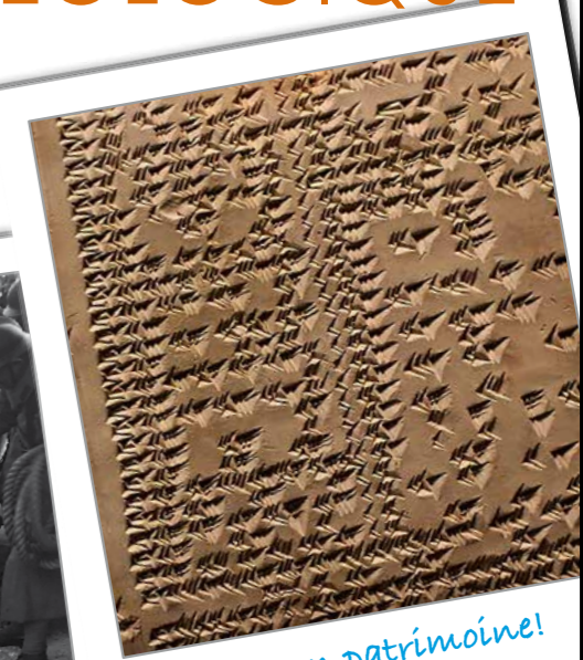
La terre, un patrimoine!