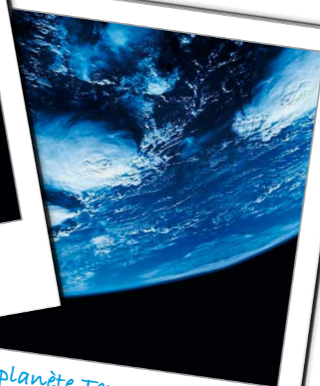
La planète Terre!