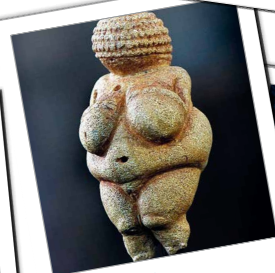
Terre - ventre