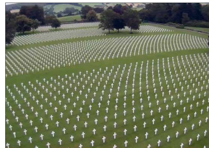
Cimetière militaire américain d'Henri-Chapelle à Hombourg

Nous aborderons la journée par une visite du superbe château de Raeren entouré de douves, qui contient une collection unique, riche de plus de 2.000 pièces de céramique rhénane, en particulier les fameux grès décorés de Raeren.