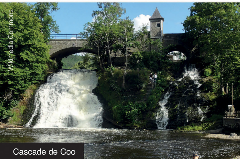
Cascade de Coo

La seconde journée vous emmènera dans la vallée de la Warche pour explorer le château de Reinardstein. Le circuit se poursuivra à la découverte du patrimoine naturel, remontant le cours de quelques ruisseaux qui drainent le plateau des Hautes Fagnes, dont nous nous approcherons. Une journée un peu plus sportive pour ce milieu de programme.