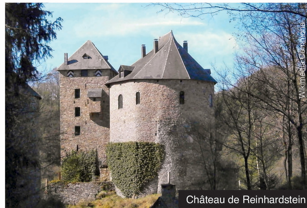
Château de Reinhardstein

L'histoire de Malmédy est fortement liée à celle de son abbaye bénédictine, fondée en 648 par Saint Remacle et associée à celle de Stavelot non loin de là. Dans les siècles suivants, une intense activité économique va s'y développer, notamment grâce à la tannerie et à la draperie. Les anciens quartiers de la ville et son patrimoine architectural témoignent encore de cette richesse passée.